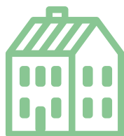
Figura 2. Esferas de conflictividad civil - OCCA